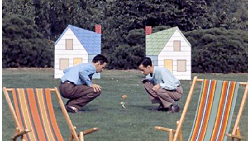
Neighbors/Voisins (1952)

Parmi les autres voies explorées, McLaren reprend la pixilation ou « stop-motion-animation », initialement employée par Méliès. Cette expérience fut utilisée pour réaliser Voisins et Two Bagatelles (1952), Il était une chaise (1957) et Discours de bienvenue (1960). Pas de Deux (1967) et Narcisse (1983) prolongent et actualisent les effets produits par la chronophotographie grâce à la technique du « slow-motion-animation » ou « animation à mouvement retardé » associée à la surimpression à la chambre optique (McLaren, « Pas de Deux »). Ces deux films, émanant de la passion du cinéaste pour la danse, seront les plus chers qu'il ait jamais réalisés, et nécessiteront tous deux un processus créatif de plusieurs années, notamment à cause de la complexité du dispositif mis en œuvre 9 .