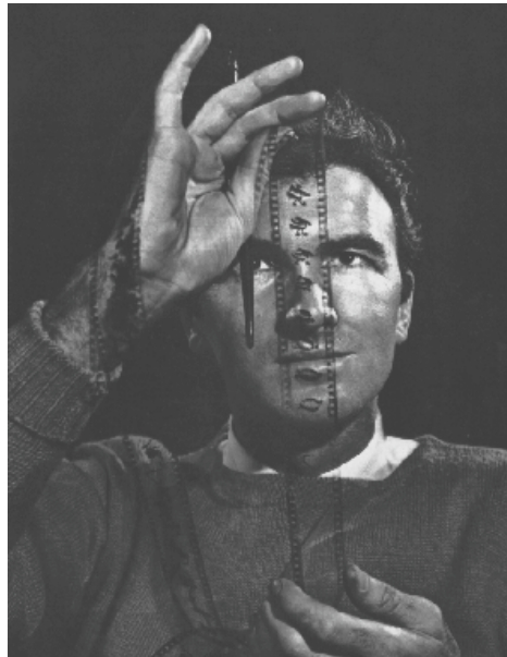
Norman McLaren

symbole de la singularité et du prestige de l'ONF, et le lieu d'une entière liberté artistique. Or, la place marginale qui lui fut accordée au sein de cet austère organisme de production gouvernementale constitua une brèche salutaire dont il est aujourd'hui possible de mesurer la portée pour l'émergence d'un cinéma national, et plus spécifiquement pour le cinéma québécois.