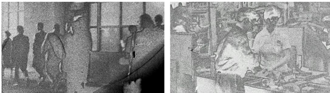
Figure 3 Photogrammes tirés du deuxième refrain, de 22 : 50 à 28 : 58, dans Miron .

Le refrain visuel est répété trois fois durant la projection du film tout en se transformant au fur et à mesure – d'où la variation dans la répétition – de la progression narrative et, à chaque fois, il présente deux, trois ou quatre leitmotive. La première fois (de 04 : 26 à 11 : 34), le refrain succède au prologue et se présente avec la voix hors champ de Miron citant le poème « La marche à l'amour ». Sa deuxième présence (de 22 : 50 à 28 : 58) est accompagnée des poèmes « L'amour et le militant », « La marche à l'amour » et « Le camarade », d'ailleurs transfigurée par un effet de surexposition. Enfin, les mêmes images (de 61 : 36 à 68 : 45) réapparaissent avec le poème « Compagnon des Amériques » et, cette fois, elles sont défigurées et embrasées jusqu'au noir total.