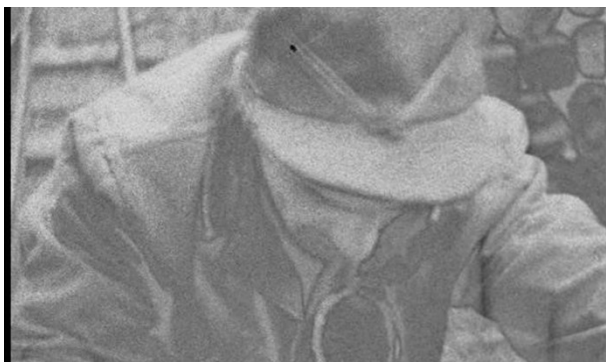
Figure 2 Photogramme tiré du plan de deux mineurs, de 60 : 17 à 60 : 38, dans Miron .

deuxième est composé des images provenant des témoignages, le troisième est la voix du poète, qui chante, parle et scande ses poèmes.