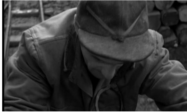
Figure 1 Photogramme tiré du plan de deux mineurs, de 15 : 54 à 16 : 13, dans Miron .