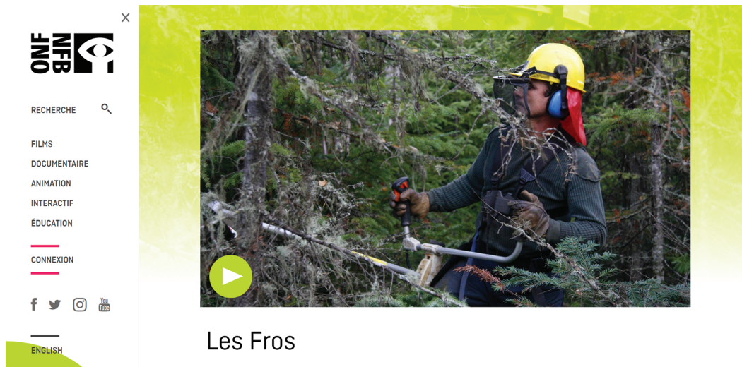
Figure 1. Capture d'écran du film documentaire Les Fros (Stéphanie Lanthier, 2010) tiré du site internet de l'Office national du film du Canada (ONF).

respectives, plus de traces, par contre, des paratextes qui ont accompagné leur sortie 12 . C'est également le cas pour les « classiques » de la filmographie documentaire québécoise. La page consacrée à la plongée dans l'industrie textile montréalaise des années 1970 du réalisateur Denys Arcand, On est au coton (1970), ne présente qu'un court synopsis et quelques questions générales présentées dans une section intitulée Éducation .