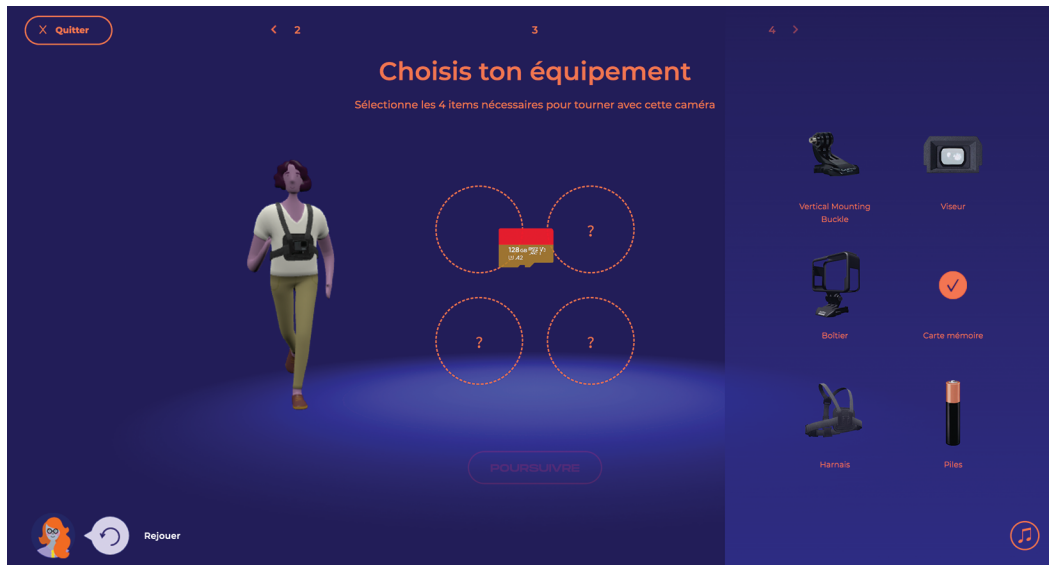
Figure 4. Capture d'écran de l'exposition Ma caméra et moi (TECHNÈS/Cinémathèque québécoise, 2021) : choisis ton équipement avec la caméra GoPro.

coulisses de la conception des films au public, et les images qu'il produit n'ont rien de neutre ou de naturel, puisqu'elles sont influencées par ses choix 28 . Il se rend ainsi compte, par l'expérimentation, du caractère tout à la fois culturellement et techniquement construit des images qu'il consulte et/ou qu'il produit. L'enjeu de ce moment interactif est en tout point comparable à celui du webdocumentaire. Dans le cas du projet De la ferme à l'assiette , l'objectif est cependant plutôt d'ordre réflexif (on invite le public à s'interroger sur la fabrication d'une image à partir d'une mise en parallèle d'une image intégrée dans le webdocumentaire et du document d'archives numérisé à sa source), alors que dans celui de Ma caméra et moi , c'est à un élargissement du domaine des objets considérés comme dignes d'intérêt (intérêt des effets de la manipulation de la caméra sur le film, plutôt qu'un intérêt uniquement pour le film) que l'on cherche à atteindre. Dans les deux cas, l'éducation à l'image passe par une prise en compte de ce qui rend possible le film (plutôt que par une étude du contenu audiovisuel du film lui-même). Ces connaissances portant sur la machinerie du cinéma entrent dans le socle de l'expertise spectatorielle. Ce sont des types de connaissance et des modes de réflexion qui pourront être remobilisés par les apprenant-es lors de la consultation d'autres films.