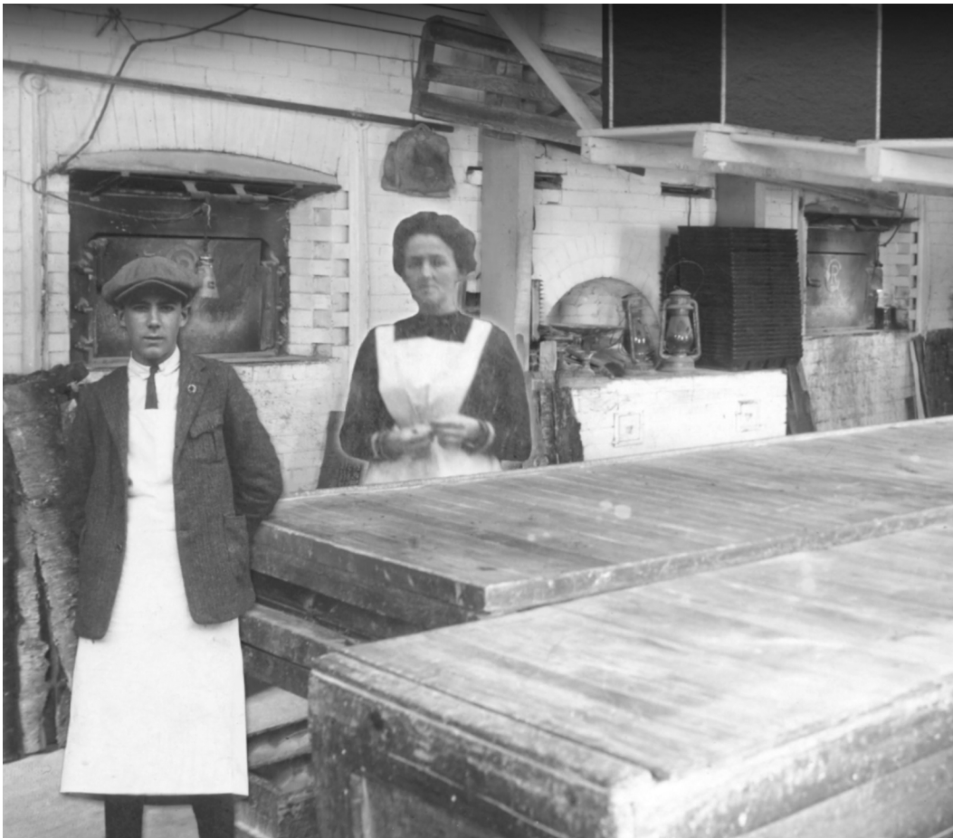
Figure 2. Capture d'écran issue du webdocumentaire De la ferme à l'assiette (labdoc / laboratoire d'histoire et de patrimoine de Montréal, 2024).

Prenons un exemple, soit l'intégration, dans le webdocumentaire, d'une séquence de type « archives » qui porte sur une photographie prise dans une boulangerie au début du xx e siècle. L'image telle qu'elle est montée dans le webdocumentaire, avec la présence de personnages ajoutés par collage [Figure 2] donne accès par un clic à une numérisation de la photographie originale [Figure 3] 22 . Une voix off explique :